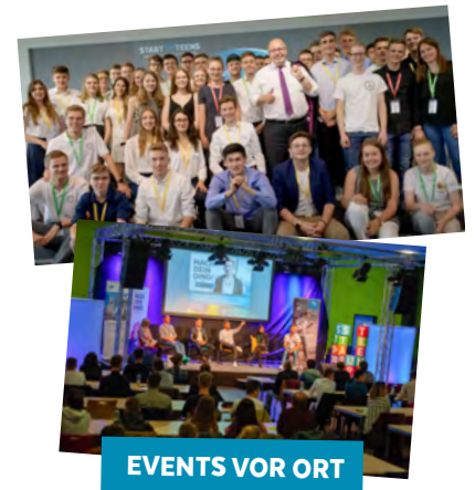
EVENTS VOR ORT

Der höchstdotierte Businessplan-Wettbewerb für Schüler*innen in Deutschland mit 7 x 10.000 Euro Startkapital.